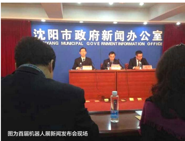
图为首届机器人展新闻发布会现场