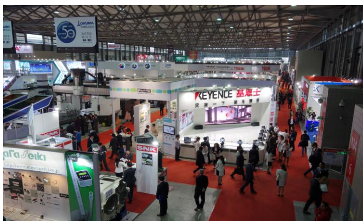
(前回 CCMT2014 の様子)